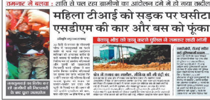
तमनार में बलवा : शांति से चल रहा ग्रामीणों का आंदोलन वनो में हो गया तब्दील। महिला टीआई को सड़क पर घसीटा एसडीएम की कार और बस को फूँका।

घटना के बाद रविवार को सुबह फिर 14 गांव के लोग पहुंचे धरना स्थल