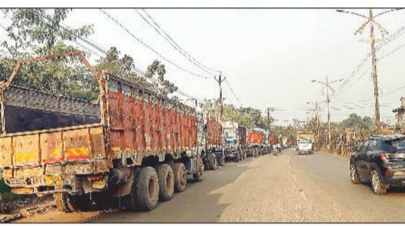
सड़क के किनारे पार्किंग करना पूरी तरह गलत है, विभाग के द्वारा ऐसे वाहनों पर कार्रवाई निरंतर की जाती है, इसके बाद भी अगर स्थिति नहीं सुधर रही है तो फिर से अभियान चलाकर इन्हें हटाया जाएगा।

सड़क किनारे अवैध रूप से हो रही गाड़ियों की पार्किंग की वजह से जिले में आए दिन दुर्घटनाएं हो रही हैं। इस अवैध पार्किंग की वजह से एक माह के अंदर ही अब तक कई एक्सीडेंट हो चुके हैं, जिसमें अब तक 5 से अधिक लोगों की जान चली गई, बावजूद इसके जिम्मेदार इस पर चुप्पी साधे हुए हैं। शहर के नेशनल हाइवे नंबर 49 पर सड़क के किनारे अवैध रूप से ट्रकों की पार्किंग की जाती है, सड़क के किनारे हर रोज ट्रकों की लंबी लाइनें खड़ी रहती हैं, रात के समय धुंध एवं अंधेरे की वजह से यह गाड़ियां दिखाई नहीं देती है जिसकी वजह से एक्सीडेंट हो रहे हैं। ट्रैफिक विभाग के द्वारा इन गाड़ियों पर कोई कार्रवाई नहीं की जा रही है। रात के समय हाइवे पर खड़ी