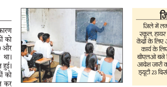
दावा आपत्ति का कार्य भी देखेंगे शिक्षक ड्यूटी करने वाले शिक्षक दावा-आपत्ति कार्य भी देखेंगे, इस कारण एक बार फिर सरकारी स्कूलों में शिक्षकों की कमी हो गई है। शिक्षकों का कहना है कि अब स्कूलों की पढ़ाई फिर से प्रभावित होगी। पहले ही स्कूल शिक्षा मंत्री द्वारा शिक्षा की गुणवत्ता सुधारने के निर्देश दिए गए हैं, लेकिन जब शिक्षक ही स्कूलों से बाहर रहेंगे तो शिक्षा की गुणवत्ता कैसे आएगी।

मतदाता सूची विशेष पुनरीक्षण कार्य के कारण सरकारी स्कूलों से बड़ी संख्या में शिक्षकों को सहायक बीएलओ (बूथ लेवल ऑफिसर) और सहायक बीएलओ नियुक्त किया गया था। इसके चलते कई स्कूलों में पढ़ाई प्रभावित हुई। बाद में लगभग डेढ़ माह बाद इन शिक्षकों को सहायक बीएलओ के कार्य से कार्यमुक्त कर दिया गया, लेकिन अब उन्हें फिर से ड्यूटी पर लगाई गई है। एसआईआर (विशेष संक्षिप्त पुनरीक्षण) के पहले चरण में सभी स्कूलों के एक-एक शिक्षक को सहायक बीएलओ बनाया गया था। इसके कारण कई शासकीय प्राथमिक शालाओं में प्रधान पढ़क के अलावा कोई शिक्षक नहीं बचा, जिससे शिक्षण कार्य प्रभावित हुआ था, स्कूलों में बच्चों के सिलेबस