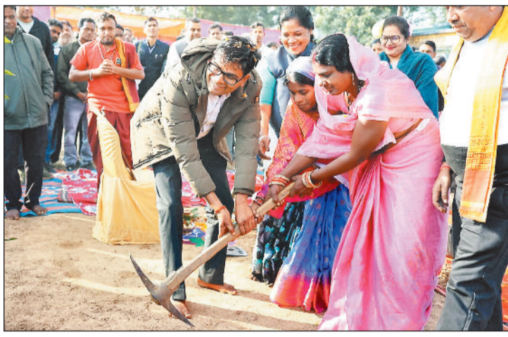
भूमि पूजन के बाद सांकेतिक निर्माण के लिए खुदाई करते वित्त मंत्री व अन्य जनप्रतिनिधि।