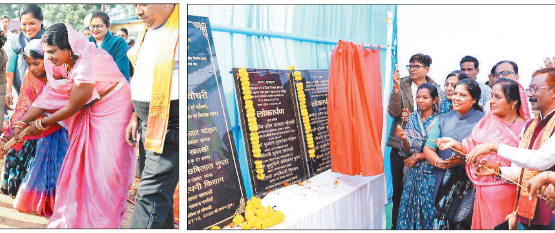
भूमि पूजन के बाद सांकेतिक निर्माण के लिए खुदाई करते वित्त मंत्री व अन्य जनप्रतिनिधि।

और जनहितकारी नेतृत्व में छत्तीसगढ़ सरकार गांव, गरीब, किसान और महिलाओं के सशक्तिकरण को सर्वोच्च प्राथमिकता देते हुए निरंतर विकास की नई इबारत लिख रही है। उन्होंने प्रदेश सरकार की ऐतिहासिक उपलब्धियों और जनकल्याणकारी योजनाओं का विस्तार से उल्लेख किया। उन्होंने कहा कि किसानों को लॉबित धान बोनस का भुगतान, धान खरीदी की सीमा और समर्थन मूल्य में बढ़ोतरी, महिलाओं के लिए महतारी वंदन योजना की