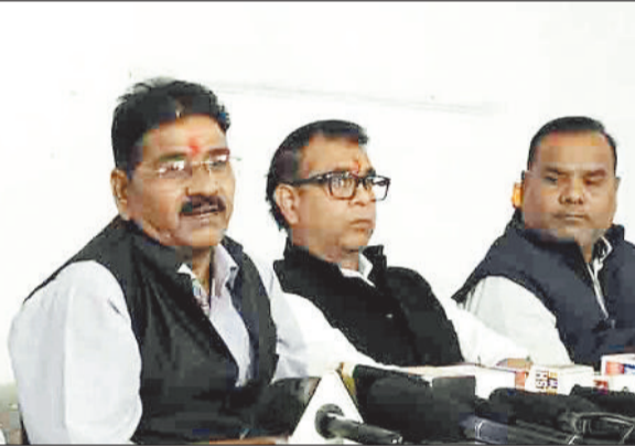
जिला प्रशासन की निष्क्रियता पर उठाए सवाल कांग्रेस नेताओं के द्वारा जिला प्रशासन पर आरोप लगाते हुए कहा गया कि हिंसा के लिए जिला प्रशासन ही पूरी तरह जिम्मेदार है। हालात बिगड़ने से पहले कलेक्टर को या किसी प्रशासनिक अधिकारी को धरना स्थल पर जाना चाहिए था। ग्रामीणों से बातचीत कर हल निकालना चाहिए था, लेकिन प्रशासन की तरफ से कोई बहाना नहीं बनाया।

शनिवार को तमनार में हुई हिंसक घटना को लेकर जिला कांग्रेस ने प्रेस कॉन्फ्रेंस का आयोजन किया। कांग्रेस के द्वारा इस घटना की न्यायिक जांच कराने, रायगढ़ कलेक्टर और एसपी को तत्काल बर्खास्त करने तथा कथित फर्जी जनसुनवाई को निरस्त करने की मांग की गई। कांग्रेस ने प्रशासन पर आरोप लगाते हुए कहा कि तमनार की घटना प्रशासनिक संवेदनहीनता का परिणाम है। यदि समय रहते ग्रामीणों से बातचीत कर समाधान की कोशिश की गई होती तो हालात हिंसा तक नहीं पहुंचते। दूसरी ओर कांग्रेस इस पूरे मामले की वास्तविक स्थिति की जानकारी लेने अपना प्रतिनिधि मंडल तमनार भेजेगी। यह प्रतिनिधि मंडल प्रभावित ग्रामीणों, प्रत्यक्षदर्शियों